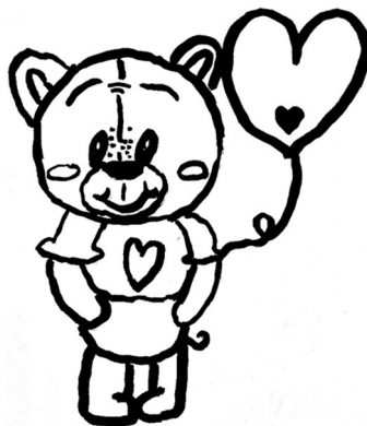
Natálie Zajíčková, 4.A

Ahoj všichni, máme tady březen a pomalu, ale jistě se nám blíží přijímací zkoušky, jak pro páte třídy, tak pro nás devátáky. Proběhl maškarní rej na téma fantasy postav z filmů a seriálů, který připravily deváté třídy.